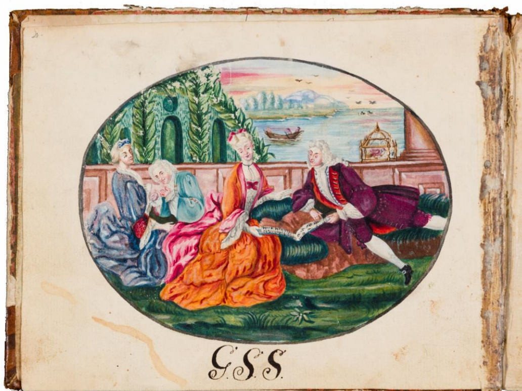
Målning i Gertrud Sophia Solanders notbok